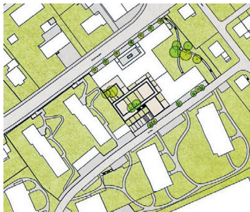
Situation heute 2025 Situation actuelle 2025

Siegerprojekt von Adrian Streich Architekten AG: zusammen bilden die Baukörper einen grossen, offenen Hof nach Süden.