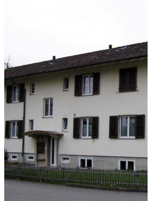
Siedlung Zofingen I, Rotfarbstrasse, mit 26 Wohneinheiten (WE), Baujahr 1950

Die BWG Graphis wird nach Möglichkeit allen Betroffenen ihre Hilfen anbieten. Eine erste Hilfe ist diese Broschüre. Mit dieser langfristigen Information erhalten alle Betroffenen Gelegenheit, in Ruhe eine Lösung zu finden.